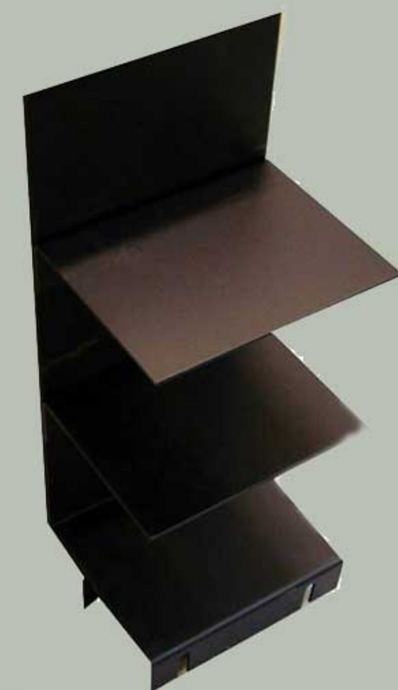
Hyldearrangement Nr. 0976 (passer til Nr. 0977 og 0977EX)