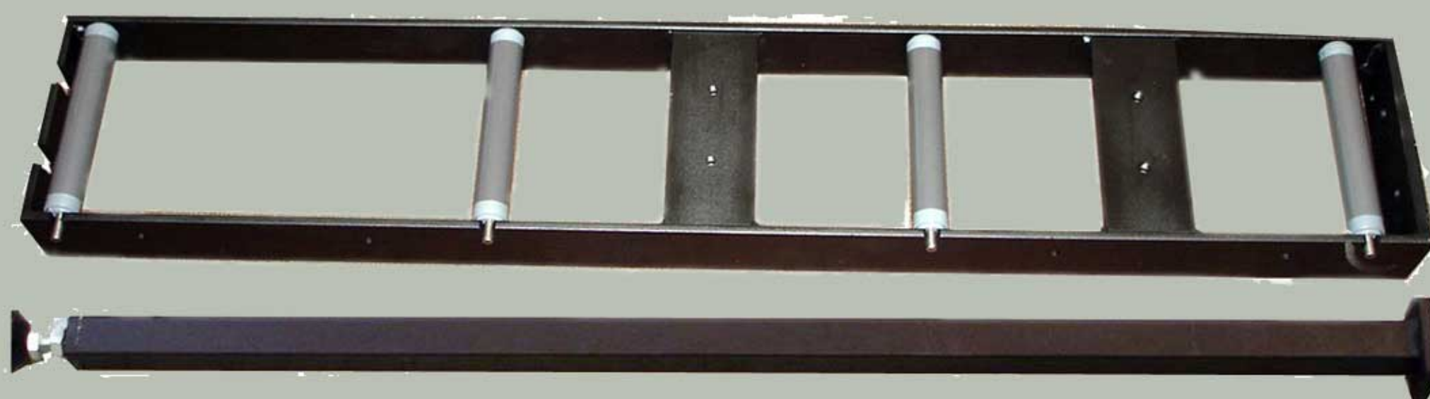
Ekstra rullebord m/støtteben, Nr. 0977EX (til at „klikke på“, Nr. 0977)