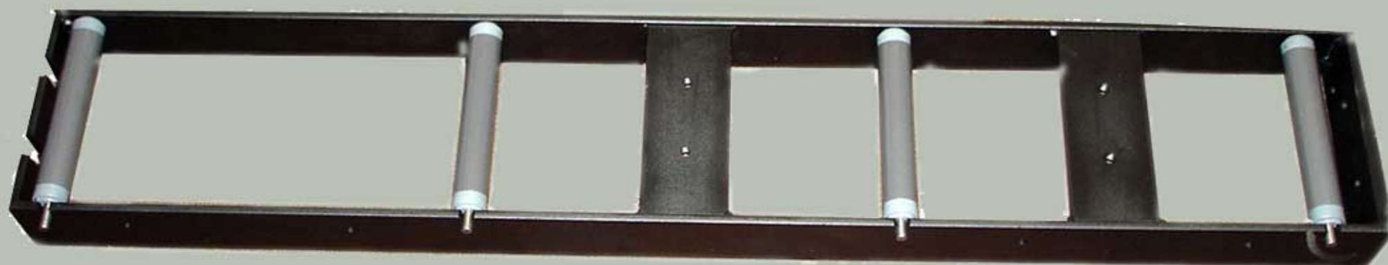
Rullebord, sektion 1, venstre, Nr. 0977